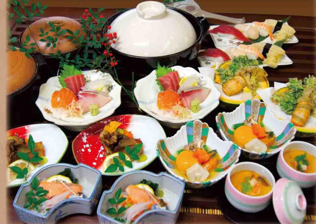
[3,000円コース例] 小鉢・焼物・お造り・茶碗蒸し・鍋又は陶板・煮物・揚物・御食事・果物

お一人様 2,700円・3,240円・4,320円 (税込) [2,500円コース] [3,000円コース] [4,000円コース]