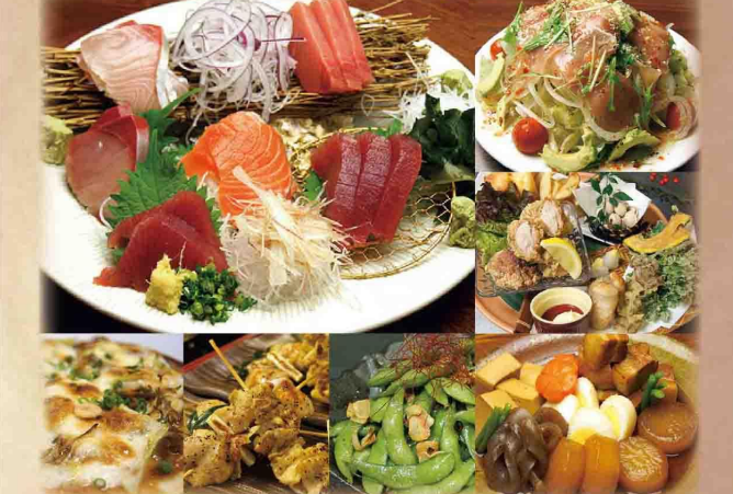
[2,000円コース例] 刺盛・串盛・角煮盛・オードブル・サラダ・ピザ・枝豆・ペロランチーニ

お一人様 2,160円・3,240円 (税込) [2,000円コース] [3,000円コース]